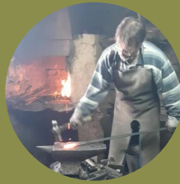
FRAGU-ART HERRERO J.EMILIO FORMARIZ